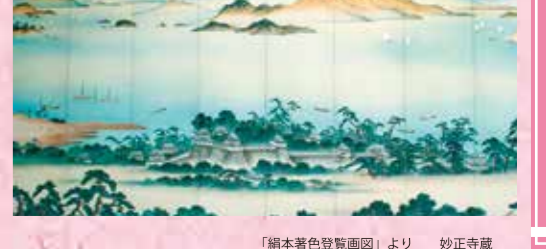
「南本著色絵巻図」より 妙正寺蔵